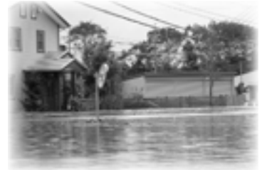
大雨による浸水被害