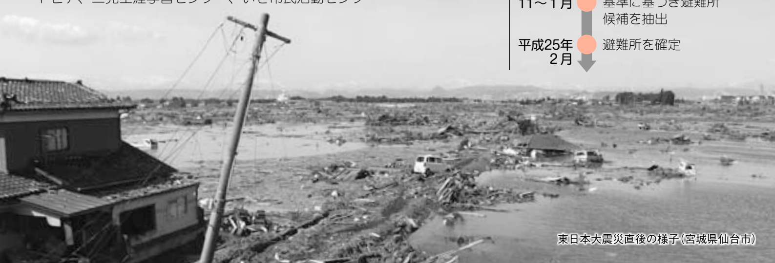
東日本大震災直後の様子(宮城県仙台市)