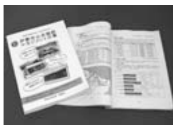
規格/A4判・290ページ 金額/2,300円

はじめ、利用・運営状況や運営費に関する情報などがまとめられ、さまざまな観点から公共施設を評価・分析し、施設の全体像を「見える化」しています。白書は、伊勢図書館・小俣図書館など市のホームページでご覧いただけます。また、同室(市役所本館・2階)で販売しています。